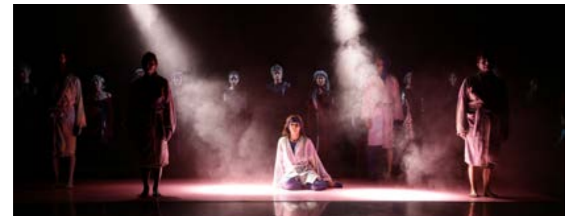
Void Island © (LA)HORDE, 2014