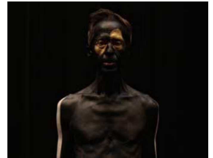
Void Island © François Stemmer, 2014

Void Island est une création développée autour des Hétérotopies de Michel Foucault. Au contraire de l'utopie, qui est un modèle idéal, l'hétérotopie est concrète et prend place dans des lieux réels, des lieux effectifs, des lieux qui sont dessinés dans l'institution même de la société, et qui sont des sortes de contre-emplacements, des lieux hors de tous les lieux, bien que pourtant effectivement localisables. Le terme senior, comme l'hétérotopie, est souvent défini par ses contraires. Il semble constituer l'envers de situations : le contraire de junior, le contraire d'actif. C'est une catégorie sociale qui se constitue en-dehors des autres, tout en restant identifiable.