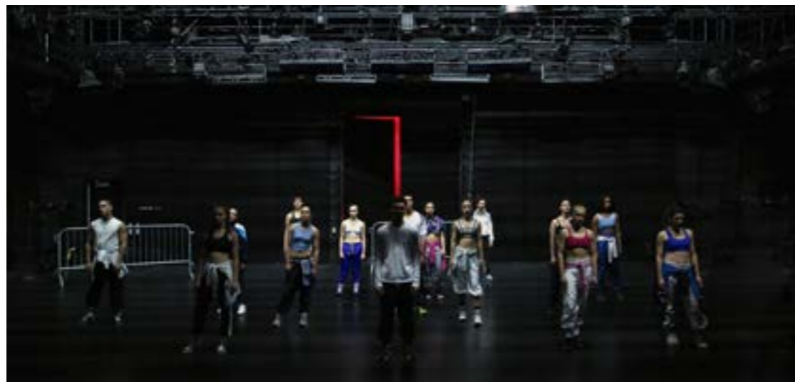
Avant les gens mouraient ©(LA)HORDE, 2015

Pièce chorégraphique pour les 15 danseurs finissants de L'École Contemporaine de Danse de Montréal développée autour du mouvement Mainstream Hardcore en réinterprétant les gestes du Jumpstyle, du Hard Jump et du Hakken.