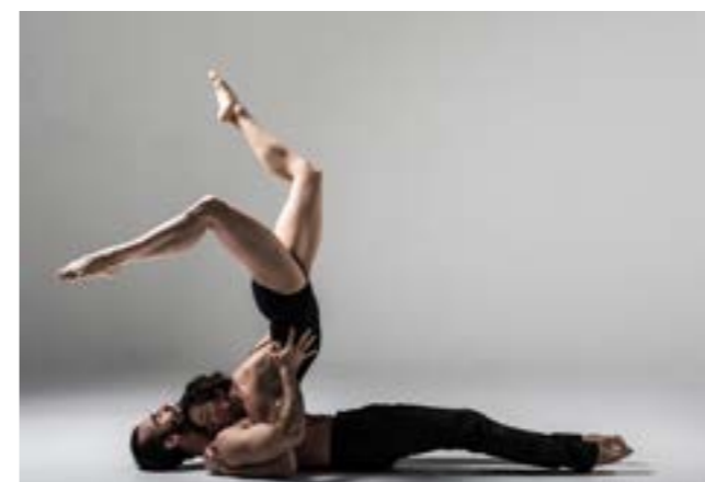
Parution dans le livre La poésie du mouvement de Julien Benhamou, photographe de l'Opéra de Paris. Publié chez Normal magazine (2018)